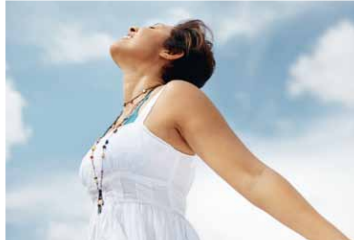
Die Wechseljahre verlaufen individuell ganz unterschiedlich. Bei einigen Frauen treten gar keine oder nur leichte Beschwerden auf.

Seit vielen Jahren wird die Bewertung von Nutzen und Risiken der HT kontrovers diskutiert. Daher ist es ganz verständlich, dass viele Frauen verunsichert sind. Das Grundprinzip sollte heißen: so viel wie nötig, so wenig wie möglich. So sieht die Deutsche Gesellschaft für Gynäkologie und Geburtshilfe (DGGG) eine medizinische Notwendigkeit der Hormontherapie in folgenden Fällen: bei Unterfunktion der Eierstöcke seit den Jugendjahren, wenn die Eierstöcke vor den Wechseljahren entfernt wurden, wenn die Wechseljahre vor dem 40. Lebensjahr eingesetzt haben oder bei nachweislicher Osteoporose. Im Einzelfall kann die HT hilfreich sein, um Herz-Kreislauf-Erkrankungen vorzubeugen, bei familiärer Osteoporose-Belastung oder wenn die männlichen Hormone überwiegen und Frauen unter Akne, Haarausfall und Damenbart leiden.